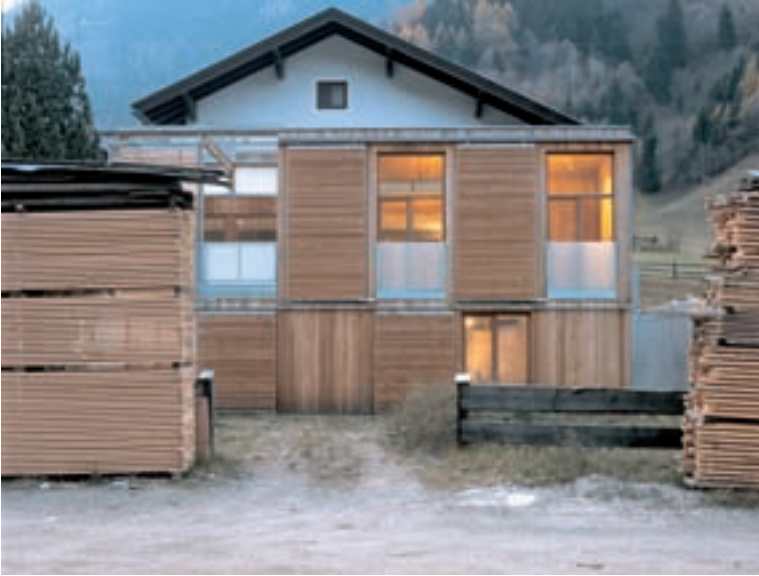
Haus Hahn; Architektur: Reinhard Suntinger

Veranstaltungen in Stadt und Bezirk Völkermarkt betreut durch Klaus Mayr Vor Anmeldung unter T: +43 664 1743270