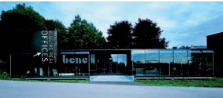
Bene/Zumtobel Klagenfurt; Architektur: Henke Schreieck