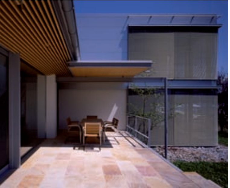
Haus G Techelsberg a. W/S; Architektur: Arch. Reinhold Wetschko