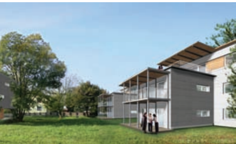
Passivhauswohnanlage Tarviserstraße Kagenfurt; Architektur: Arch. Klaura & Kaden