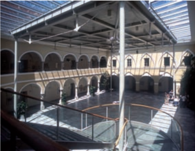
FH Technikum Kärnten Spittal; Architektur: TEAM A GRAZ