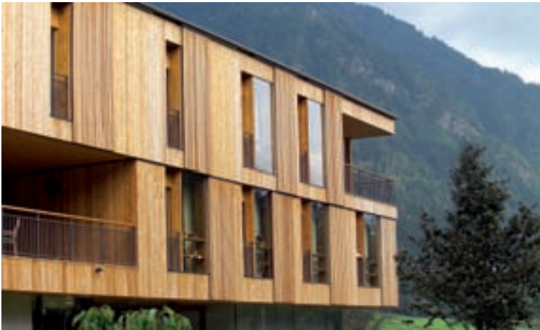
Altenwohnheim Steinfeld; Architektur: Arch. Dietger Wissounig

Die Entdeckungsreise reicht von der Verknüpfung von Architektur mit Wirtschaft oder Tourismus bis hin zur Auseinandersetzung mit alter Bausubstanz und deren Revitalisierung. Auch Bereiche wie Film und Werbung werden auf die Verbindung zur Architektur hin unter die Lupe genommen. Die Arbeiten werden am 9. Juni, 10.00 Uhr, im Schulzentrum im Zuge einer Ausstellungseröffnung präsentiert.